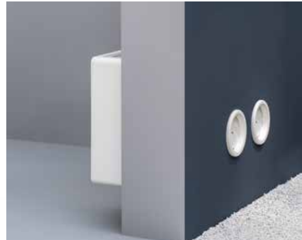
Darstellung Wandmontage mit den zwei Wanddurchführung und Aussenwandklappen, Optional erforderliche Wanddurchführung für Kondensatabläufe.

Eine wichtige Wahl nicht nur aus Designgründen sondern auch um die Installation zu vereinfachen. Es ist leichter Werkzeug zu bekommen und man benötigt keine professionellen Bohrmaschinen mehr. Kleinere Bohrlöcher fallen an der Außenfassade noch weniger auf.