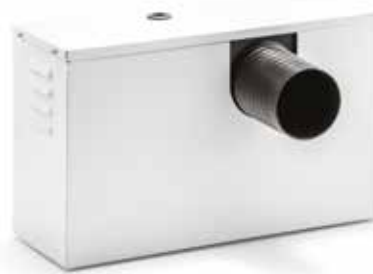
SCBR3 Zerstäuber Soloclim

SCBR3 wird über die Ablassleitung für Kondensat des Soloclim versorgt. Dieses wird zerstäubt, verdampft und dank des innovativen Systems mit piezoelektrischen Zellen ausgestoßen. SCBR3 kann sowohl innen (mit Wandbohrung 80 mm) als auch außen installiert werden.