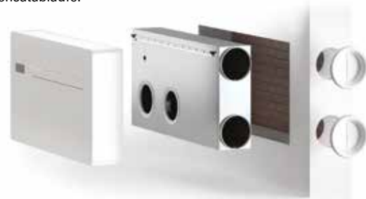
Soloclim mit seitlichem Ausblas-Kit

Soloclim kann an jeder geraden Wand installiert werden, in Fuß- oder Kopfhöhe. Alle Teile die für die Installation benötigt werden (Schrauben, Bohrschablone, Abdeckklappen, Rohrpappen) sind im Lieferumfang inbegriffen. Ein optionales Wandeinbaukit ermöglicht es, eine um 90° versetzten Ausblasrichtung zur Aussenwand zu realisieren. Bei hoher Montage sollte eine Unterseitenabdeckung verwendet werden. Eine Bohrmaschine ist das einzige, was separat für die Installation benötigt wird.